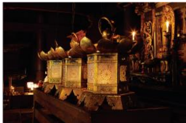
▲1200年灯り続ける不滅の法灯