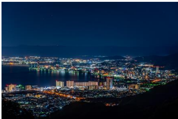
▲比叡山から望む夜景（大津市街地）