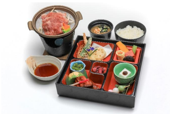
▲峰道レストランのお食事