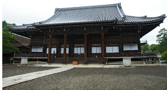
▲明智光秀ゆかりの西教寺