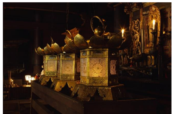
▲根本中堂 (不滅の法灯)