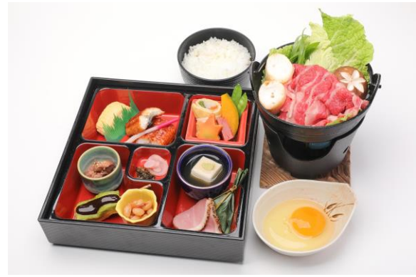
▲峰道レストラン&展望台でのお食事 (イメージ)