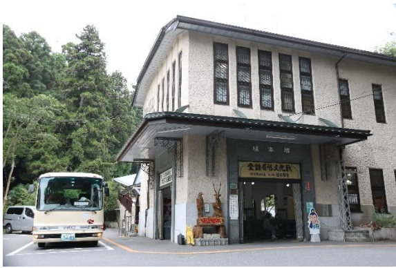
▲坂本ケーブル「坂本駅」（登録有形文化財）