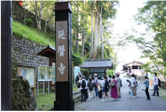
▲延暦寺巡拝所での説明