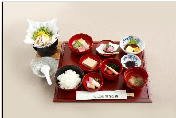
▲延暦寺会館でのお食事「精進懐石膳」