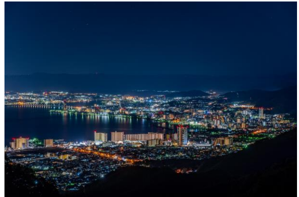
▲比叡山から望む夜景（大津市街地方面）