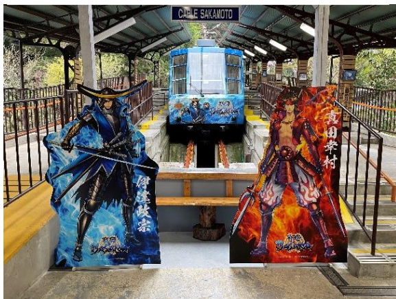
▲坂本ケーブル（戦国 BASARA ラッピング 車両は、2021年12月26日まで運行）