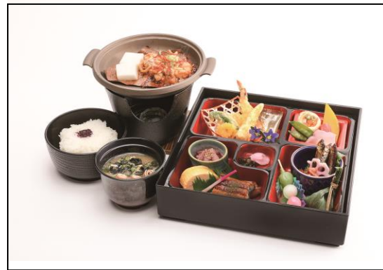
▲峰道レストラン&展望台でのお食事