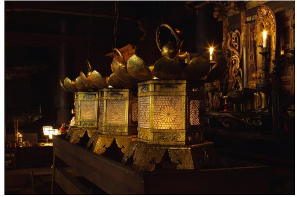
▲比叡山延暦寺・根本中堂（国宝）