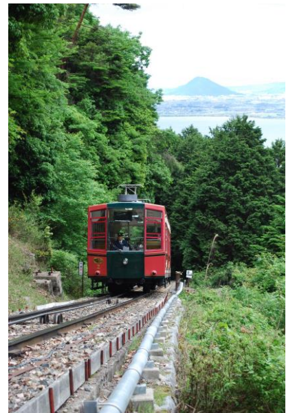
▲坂本ケーブルから三上山を望む (2022年1月より)