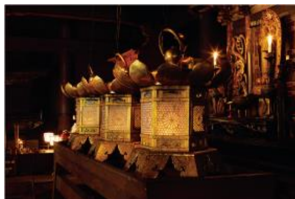
▲比叡山延暦寺の根本中堂(国宝)