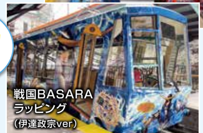
戦国BASARA ラッピング (伊達政宗 ver)