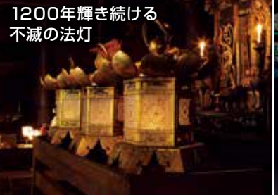
1200年輝き続ける 不滅の法灯